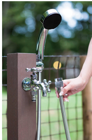
アダプタージョイント付きで簡単に着脱ができます。