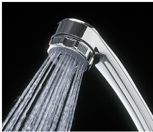
吹き出し口のリングを回転させ、ワイドスポットに切り替えます